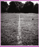
A Line by Walking, Richard LONG, 1967

tendance de l'art contemporain utilisant le cadre et les matériaux de la nature