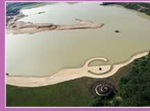
Broken Circle, Robert SMITHSON, 1971