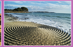
Lignes dans le sable, Roger DAUTAIS, 2010