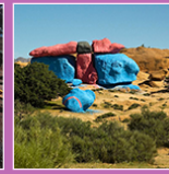
Roches bleues à Tafraoute, Jean VERAME, 1984