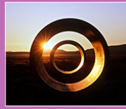
Sun Tunnel, Nancy HOLT, 1976