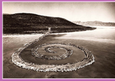
Spiral Jetty, Robert SMITHSON, 1970